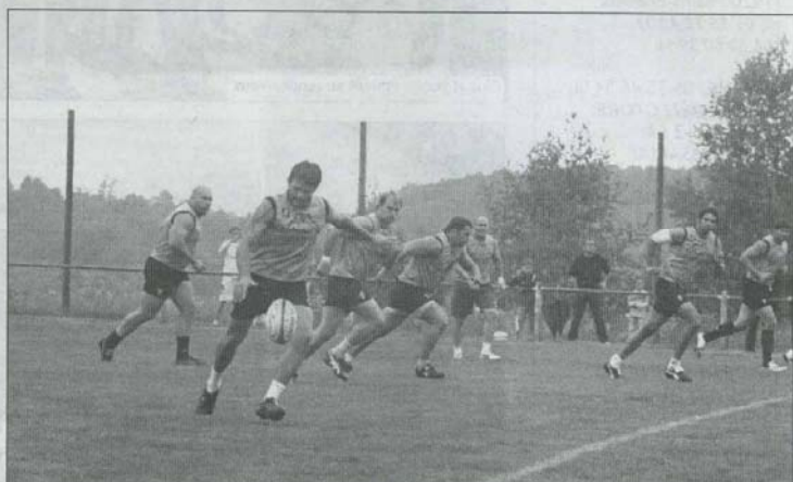
...mais aussi du jeu avec des oppositions déjà impressionnantes