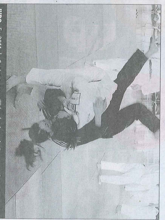
JUDO. En 2011, le Centre a accueilli les équipes de France cadets et juniors. Cette année, Teddy Riner et l'équipe de France pourraient bien Venir aussi.