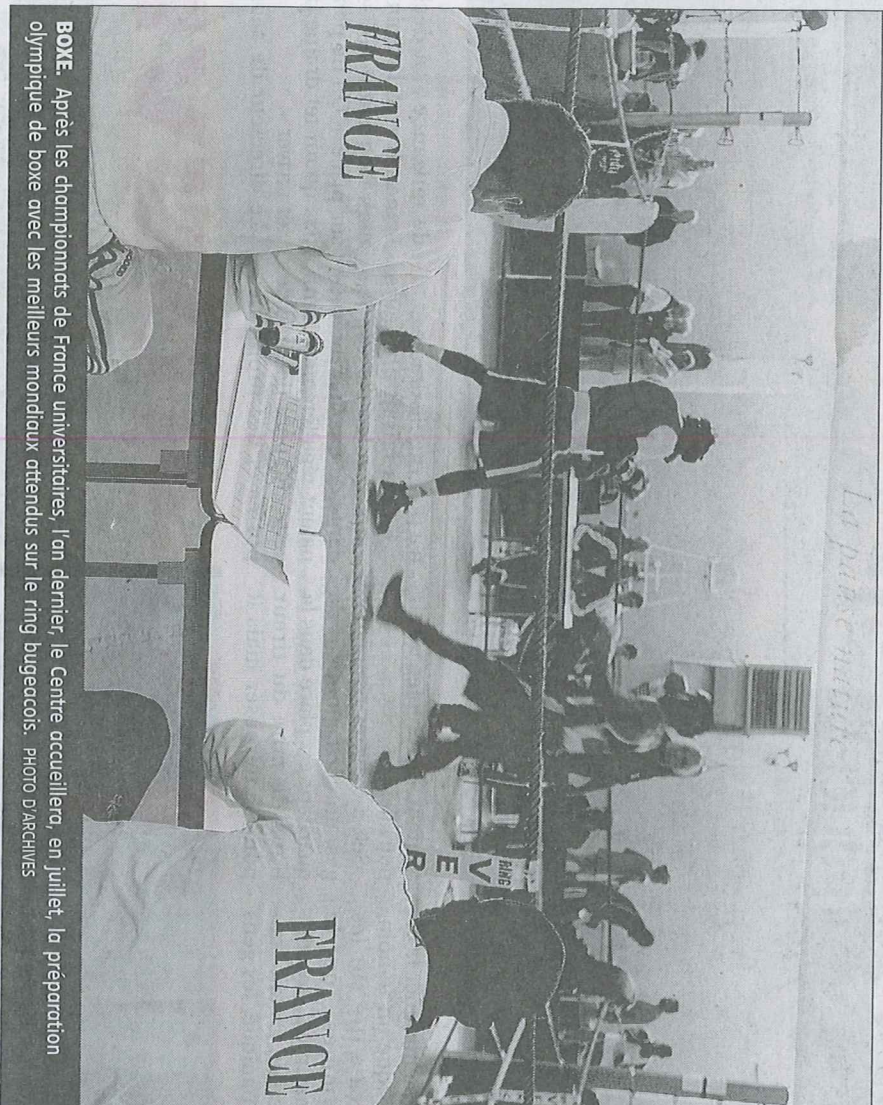
BOXE. Après les championnats de France universitaires, l'an dernier, le Centre accueillera, en juillet, la préparation olympique de boxe avec les meilleurs mondiaux attendus sur le ring bugéacois.

trouveraient sur Bugéat un cadre naturel idéal pour un raid avant les JO. Côté tendez-vous inscrits dans le marbre, la préparation internationale de boxe pour les touristes qualifiés aux JO du 26 mars au 6 avril avec la crème mondiale des boxeurs. Avant l'événement de juillet et la préparation olympique de boxe du 6 au 16 juillet, devenue un rituel depuis 2004 et 2008. ■