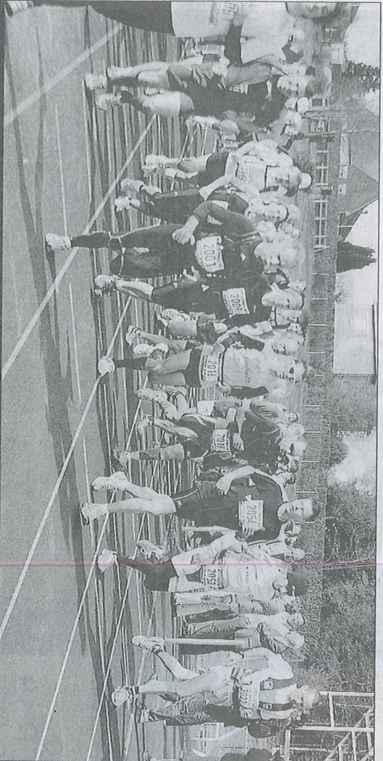
TRAIL. Le trail de Bugéat est devenu un événement et a rassemblé plus de 150 athlètes. l'an dernier.

Août. Stage jeunes équipes de France de karaté du 5 au 11 août. En vue, la préparation du championnat du monde.