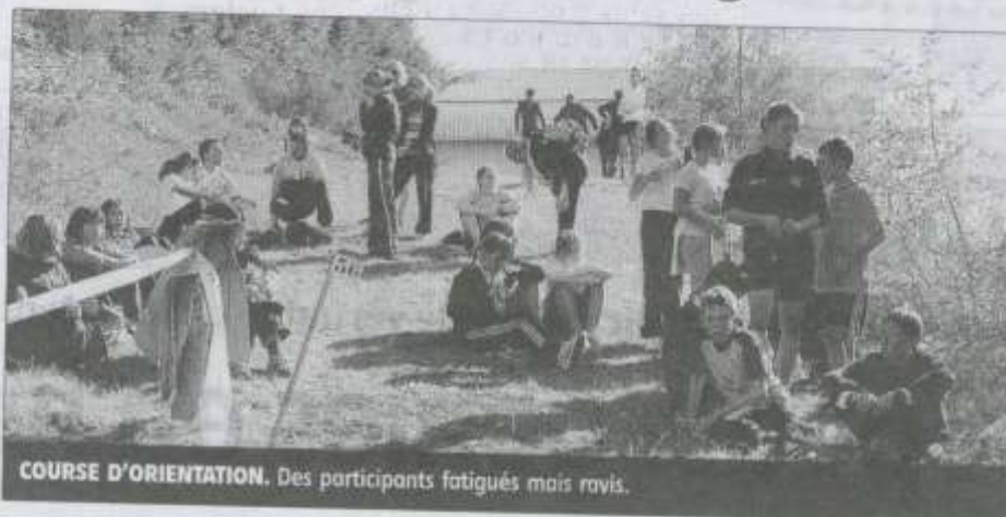
COURSE D'ORIENTATION. Des participants fatigués mais ravis.