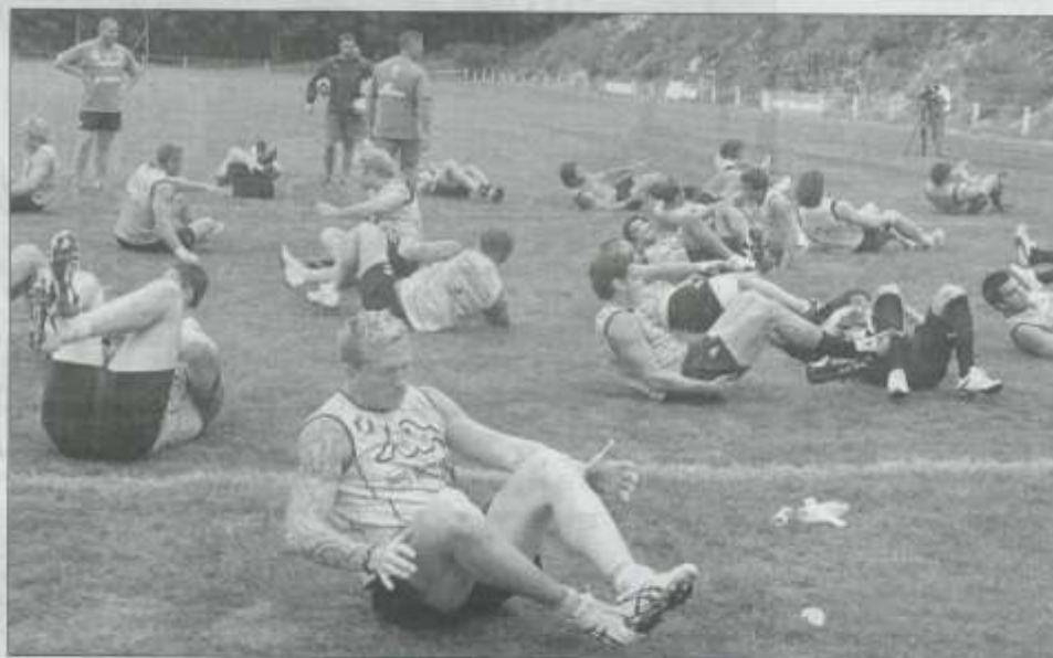
Un peu de physique encore pour le CA Brive Corrèze...