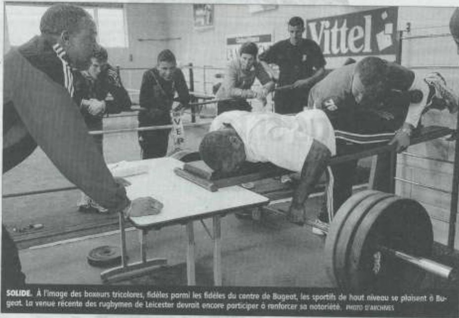
SOLIDE. À l'image des boxeurs tricolores, fidèles parmi les fidèles du centre de Bugeat, les sportifs de haut niveau se plaisent à Bugeat. La venue récente des rugbymen de Leicester devrait encore participer à renforcer sa notoriété.

Avec la venue du club champion d'Angleterre, l'Espace Mille Sources a signé son plus joli coup de l'année et s'affirme davantage encore comme un