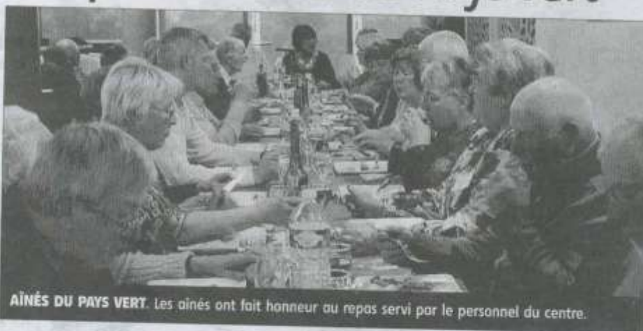
AÎNÉS DU PAYS VERT. Les aînés ont fait honneur au repas servi par le personnel du centre.