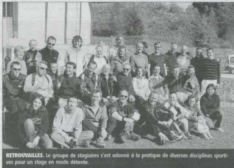
RETROUVAILLES. Le groupe de stagiaires s'est adonné à la pratique de diverses disciplines sportives pour un stage en mode détente.

En effet, aucun entraînement spécifique à leur pratique n'était au programme et le matériel de