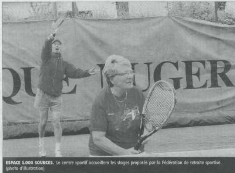
ESPACE 1.000 SOURCES. Le centre sportif accueillera les stages proposés par la Fédération de retraite sportive. (photo d'illustration)