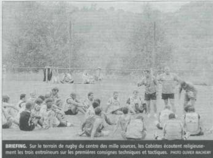
BRIEFING. Sur le terrain de rugby du centre des mille sources, les Cobistes écoutent religieusement les trois entraîneurs sur les premières consignes techniques et tactiques.

réziens se sont offert leur seule activité détente de ce charmant séjour : une ballade en kayak sur le lac de Viam.