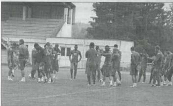
L'équipe du Mans réunie en fin d'entraînement

L'Echo propose encore des places gratuites pour le match de football Le Mans-Clermont samedi à 18h au stade Alexandre-Cueille à Tulle. Contactez l'agence de Tulle, 14 rue J. Jaurès au 05 55 26 72 75.