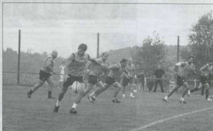
...mais aussi du jeu avec des oppositions déjà impressionnantes