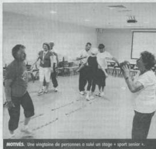
MOTIVÉS. Une vingtaine de personnes a suivi un stage « sport senior ».

« Pendant quatre jours, on a multiplié les activités de la sorte comme aussi l'aquagym, la ran-