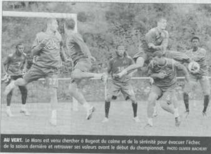
AU VERT. Le Mans est venu chercher à Bugeat du calme et de la sérénité pour évacuer l'échec de la saison dernière et retrouver ses valeurs avant le début du championnat.

Au programme de la semaine : footing à la des-