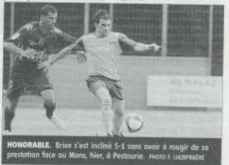
HONORABLE. Brive s'est incliné 5-1 sans avoir à rougir de sa prestation face au Mans, hier, à Postourie.