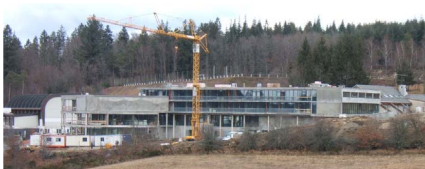
Les travaux extérieurs laissent place à l'aménagement intérieur.